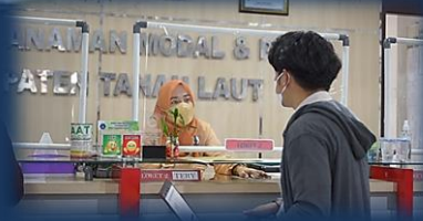
Pelayanan Perizinan Berusaha