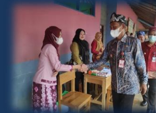
Pelayanan Keliling Perizinan Berusaha